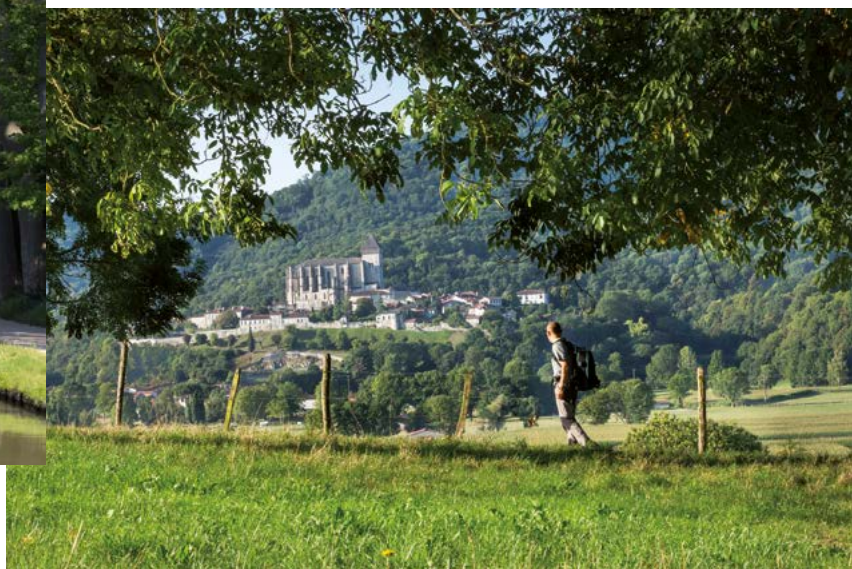
Balade du côté de Saint-Bertrand-de-Comminges